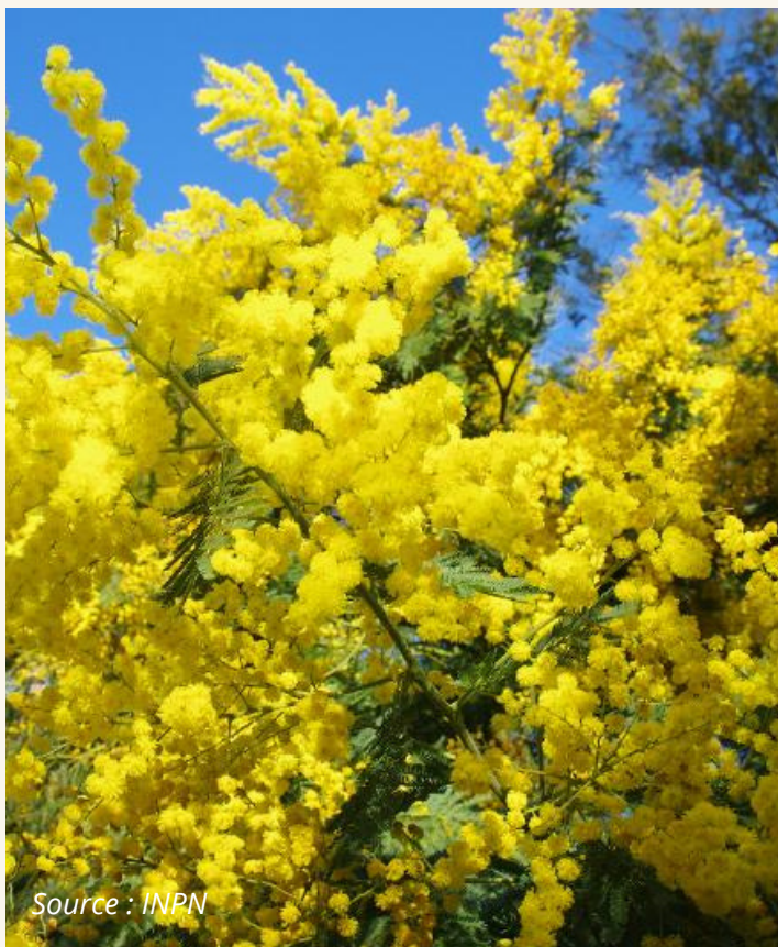
Mimosa argenté, Mimosa des fleuristes Acacia dealbata Fabaceae