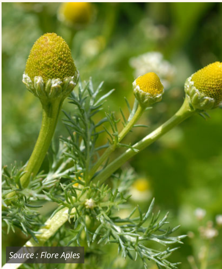
Matricaire fausse-camomille Matricaria discoidea DC Asteraceae