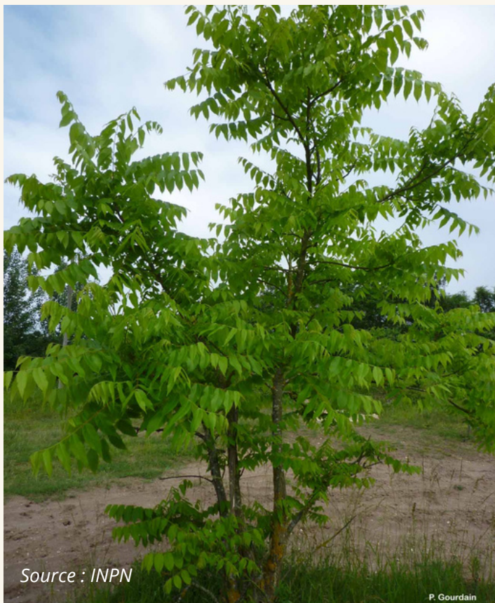
Ailante glanduleux, Faux vernis du Japon Ailanthus altissima Simaroubaceae