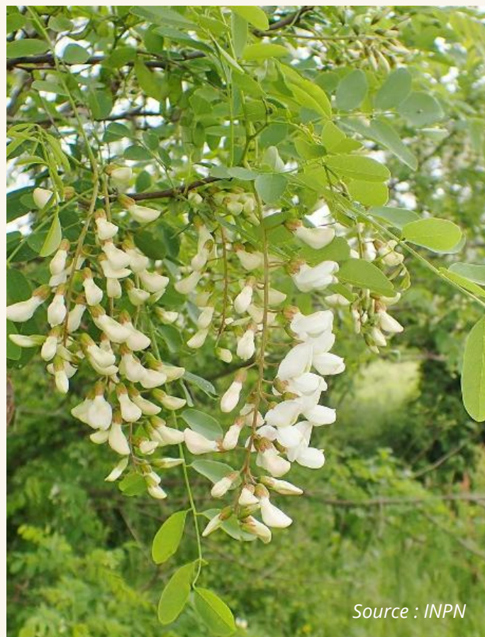
Robinier faux-acacia Robinia pseudoacacia Fabaceae