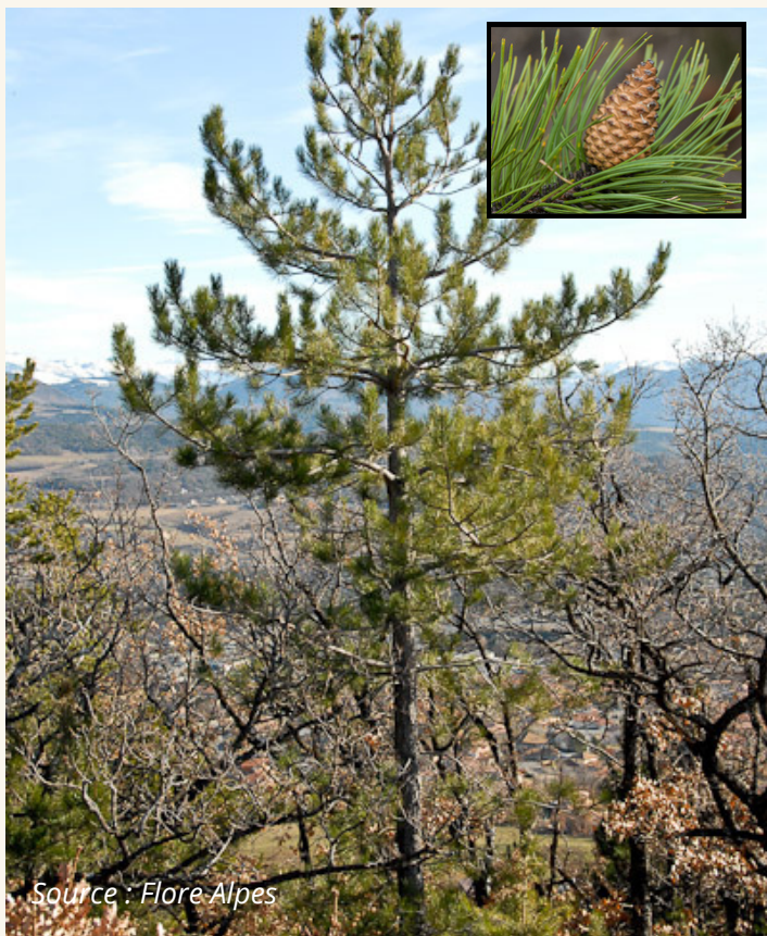
Pin noir Pinus nigra subsp nigra Pinaceae