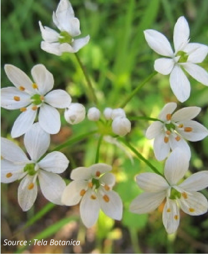
Ail presque hirsute, Ail presque hérissé Allium subhirsutum Alliacées