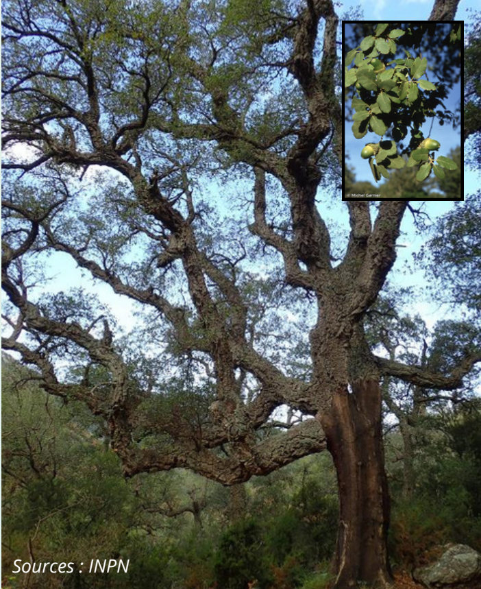
Chêne liège Quercus suber Fagaceae