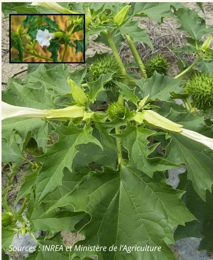
Datura, stramoine Datura stramonium Solanaceae