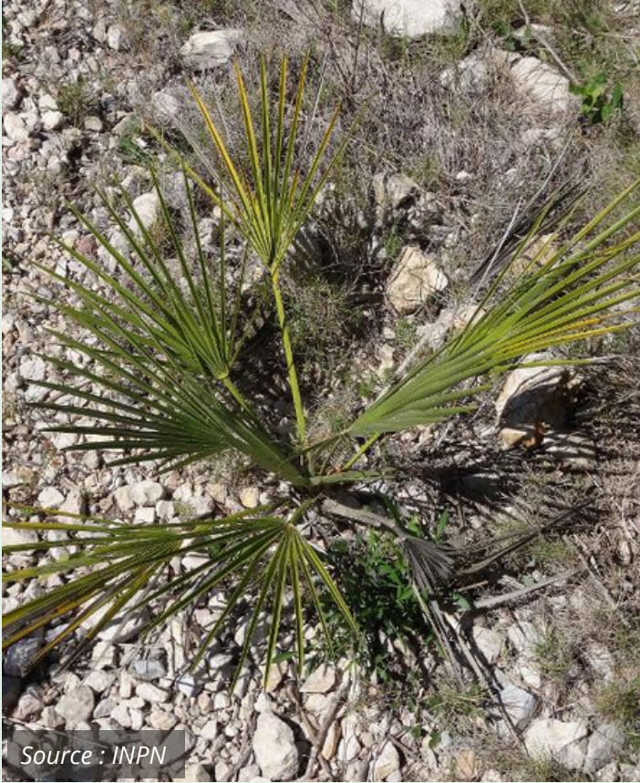
Chamaerops humble Chamaerops humilis Arecaeae