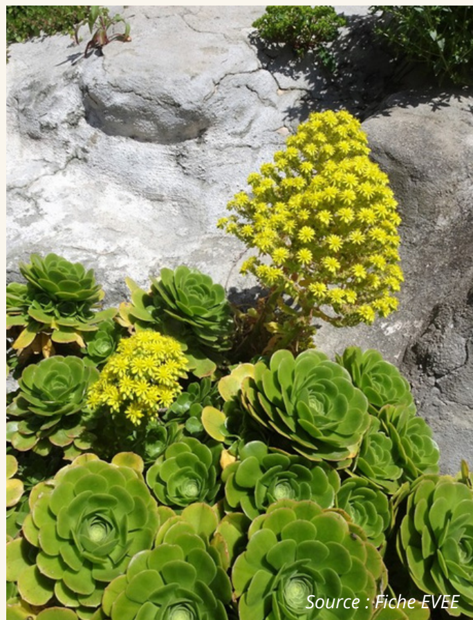
Aéonium en arbre, chou en arbre Aeonium arboreum (L.) Webb & Berthel. Crassulaceae